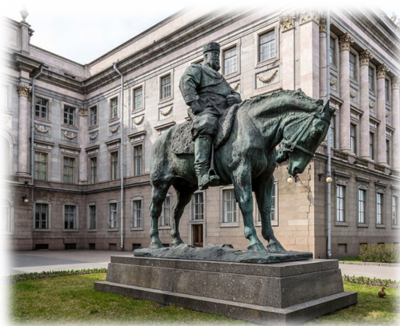
П. П. Трубецкой. Памятник Александру III во дворе Мраморного дворца, Санкт-Петербург

Задание. Из дополнительных источников узнайте «беспокойную» судьбу этого памятника.